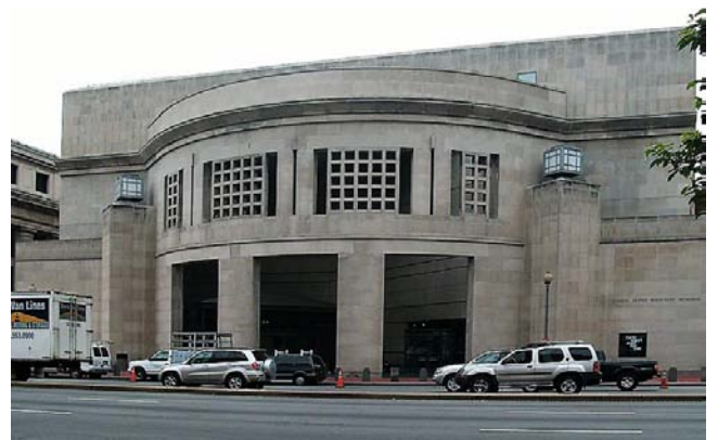
Национальный музей Холокоста в Вашингтоне