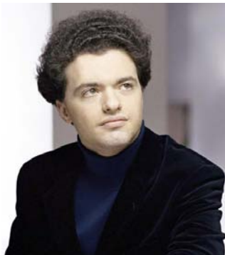
Вый еврейский ребенок в пионерском галстуке...

Один из самых знаменитых пианистов мира поговорил с корреспондентом «Лехаима» не только о музыке, но о своем новом языке, об обретенной стране и стихах, которые сопровождают его всю жизнь.