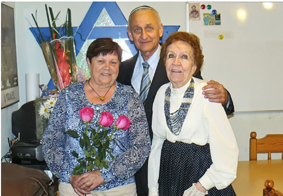
16 августа 2015 г.