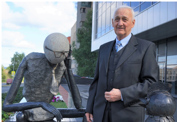
16 августа 2025