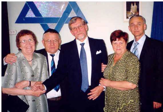
«Группа захвата». 16 августа 2005 г.