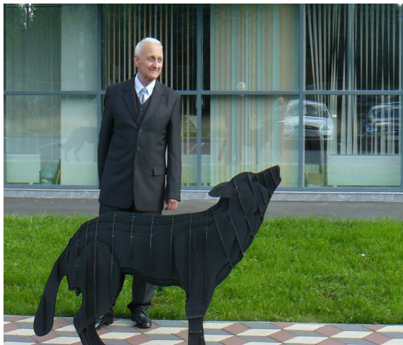
16 августа 2020 г.