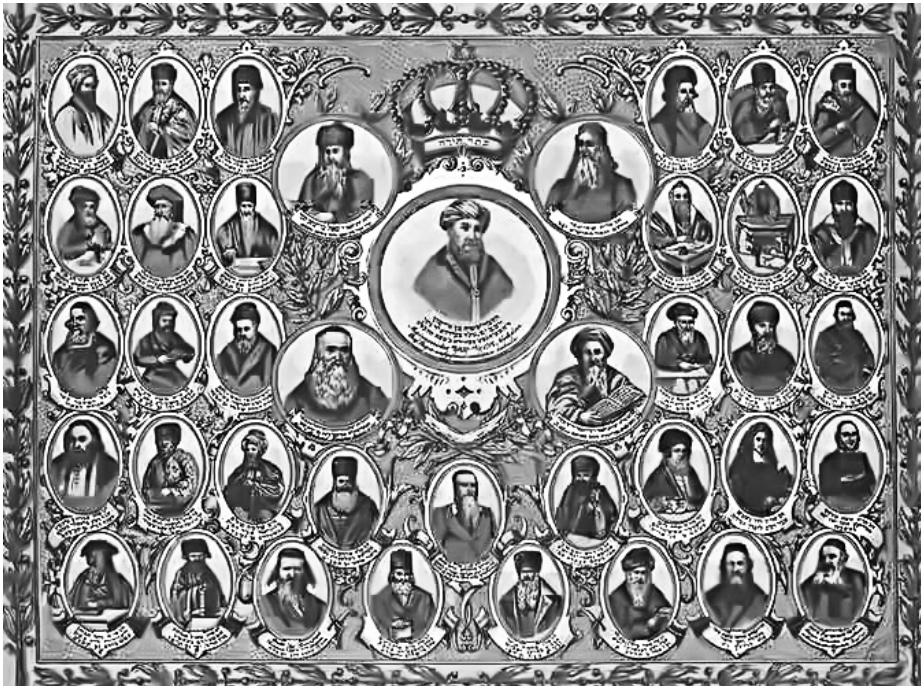
«Великие раввины Израиля» (в центре Маймонид). Конец XIX - начало XX века

Люди, не слишком разбирающиеся в иудаизме, нередко считают раввинов «еврейскими священниками». Между тем более неподходящее определение трудно найти. Институт священства у евреев действительно есть; еврейские священники (коэним) - это потомки Аарона, брата Моше, которым Тора предоставила исключительное право приносить жертвы. Пока существовал Храм, священники, естественно, главенствовали в религиозной, а временами и в политической жизни еврейского народа. Однако сегодня их особая роль сводится к нескольким церемониям, и непосредственного отношения к духовному руководству они не имеют.