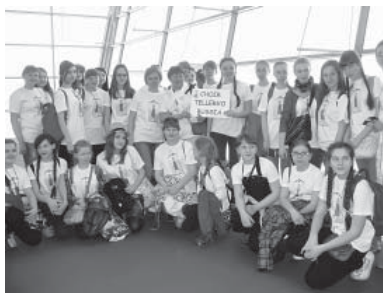
В аэропорту Бен - Гурион