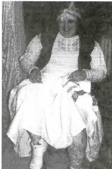
До встречи на Святой земле!

Мне будет не хватать моего ансамбля - это большой кусок моей жизни, людей, которые были рядом со мной. Но у каждого свой путь, и меня зовет моя судьба. Я желаю тем, кто остается, возвращения в еврейство - это огромный мир, целая цивилизация, и обидно, что для некоторых этот мир "за семью печатями". Только не говорите, что "нет времени"! Ерунда! Если есть желание - будет и возможность.