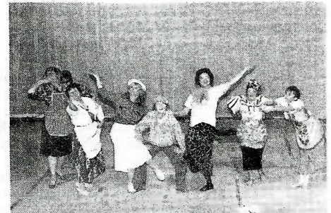
На сцене ансамбль «Авив»